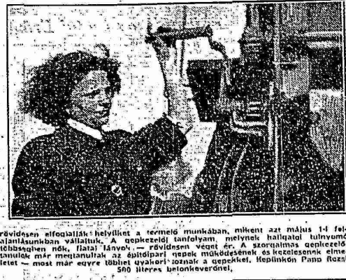
...a gépkezelők... a munkájukat...