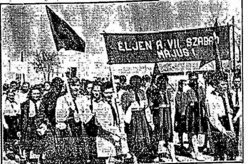
Együtt ünnepelnek az építőikkel a munkások és a dunapenteléni úttörők.