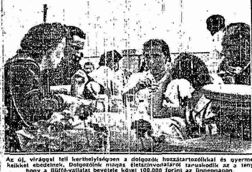
Az új, virággal teli kerthelyiségen a dolgozók hozzátartozóival és gyermekeikkel ebédelnek. Dolgozóink maguk díszítésvalláról tanusították az a tény, hogy a Büfé-vállalat bevétele közel 100.000 forint az ünnepnapon.